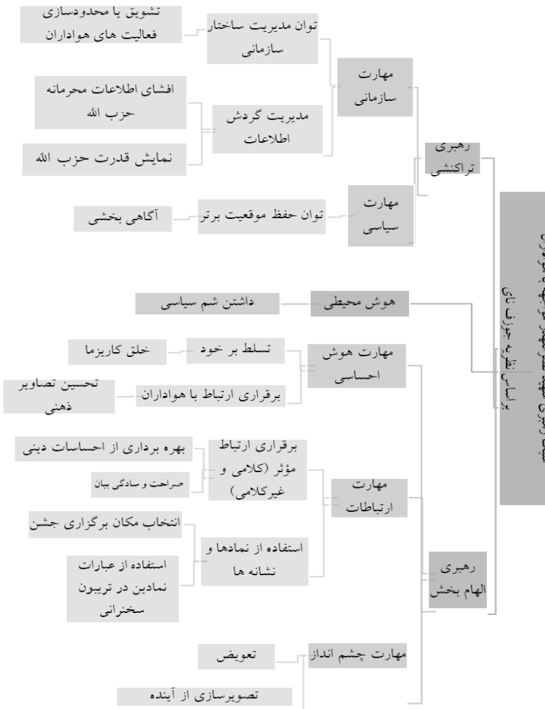
شکل ۲: مدل مفهومی سبک رهبری شهید نصرالله در مواجهه با هواداران (منبع: نگارندگان)

از رژیم اسرائیل تصویر کند. آشکار شدن نقشه‌هایی که وی به وجود آنها در منطقه اشاره کرده و نیز تحقق پیش‌بینی شکست رژیم اسرائیل و داعش در برابر مقاومت، علاوه بر بهر خ کشیدن شمّ سیاسی، کاریزمای وی را نزد مخاطبان هوادارش بالا برده است.