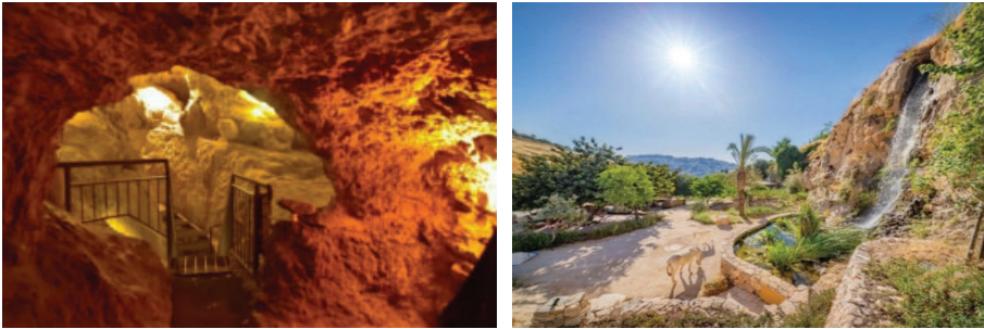
فضاهای مربوط به بنیاد شهر دیوید