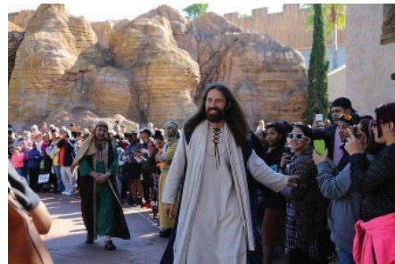
پارک تجربه سرزمین مقدس (HLE) در آمریکا