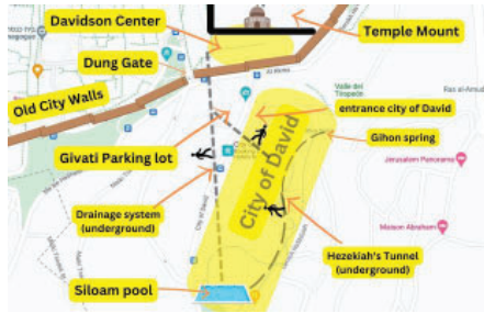
فضاهای مربوط به بنیاد شهر دیوید