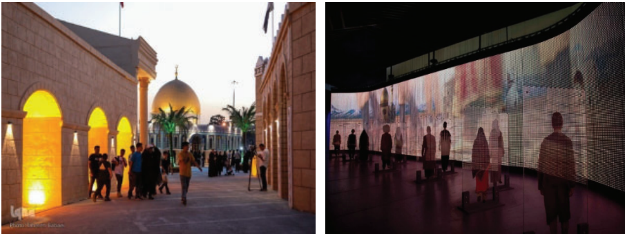
باغ‌موزه انقلاب اسلامی و دفاع مقدس در ایران (راست) و نمایشگاه سرزمین تمدن‌ها در ایران (چپ)