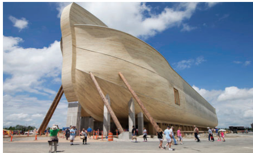
مجموعه‌ی مواجهه با کشتی نوح (ع) در آمریکا