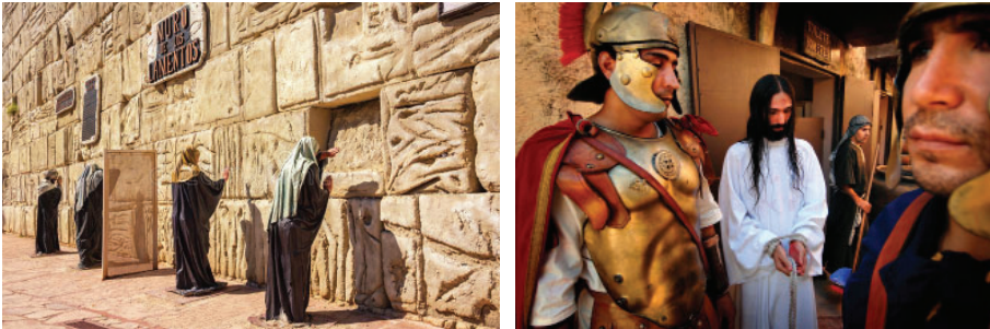
پارک تیرا سانتا در آرژانتین