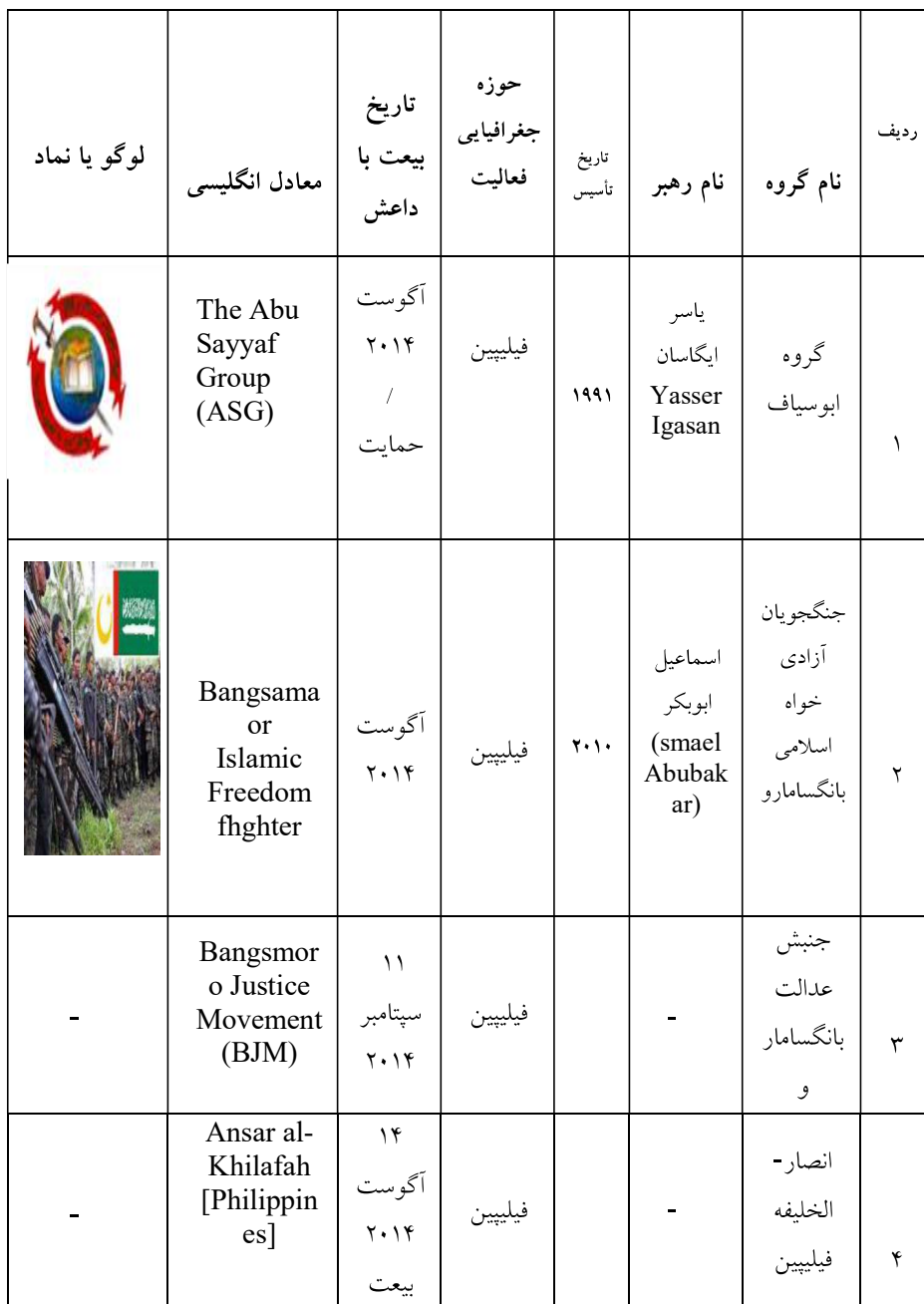
جدول شماره ۲: فهرست گروه‌های تکفیری متحد داعش