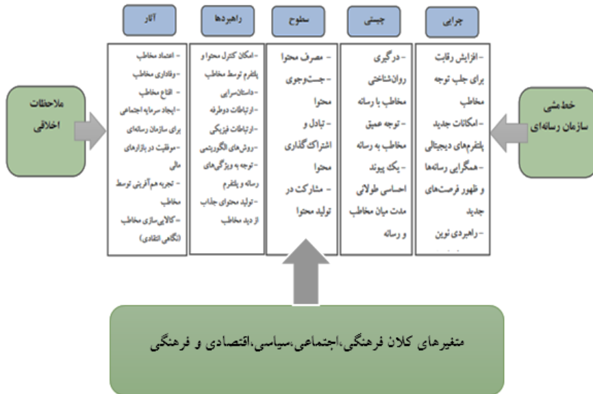
شکل ۱. چارچوب مفهومی درگیرسازی مخاطب (خواجه‌ئیان و همکاران، ۱۳۹۸: ۴۹)