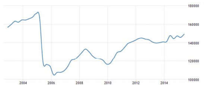
جدول شماره ۱

اما پس از درگذشت کریستینا فرناندز، شوهر نستور کریشنر، در سال ۲۰۱۰ میلادی، روندهای اقتصادی پیشین تا حدودی بازگشت. بالا رفتن تورم، کاهش رشد اقتصادی و افزایش جرائم به تدریج نمایان شد و در سال ۱۳۹۴ش (۲۰۱۴م) به اوج خود رسید (جدول شماره ۱). تورم تا حدود ۲۵٪ بالا رفت و اقداماتی چون تخصیص یارانه به حامل‌های سوخت و مانند آن، دیگر پاسخگوی نیازهای اقشار ضعیف نبود. دوباره فقر داشت چهره خود را در آرژانتین پس از چندین سال نشان می‌داد و بیم از بروز بحرانی دیگر، این بار به دلیل افراط در سیاست‌های چپ‌گرایانه، در افکار عمومی احساس می‌شد.